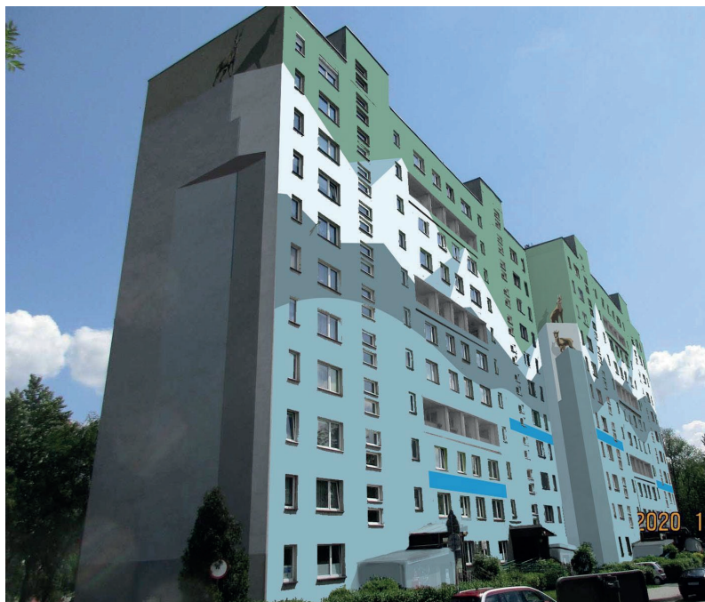
WIZUALIZACJA ELEWACJI BUDYNKU PRZY UL. MORSKIE OKO 23